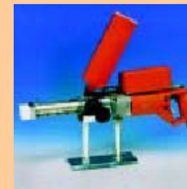
K 25 DE-G