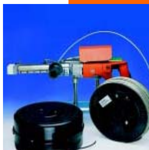
Drut do zgrzewania

POLYTECH Sp. Z o.o Grupa Agru, Frank, Plasson Ul. Bukowskiego 53, 52-418 Wrocław Tel / fax : 0 71 364 43 71; 364 46 71