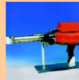
K 50 D