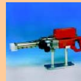
K 23 DE / K 30 DE