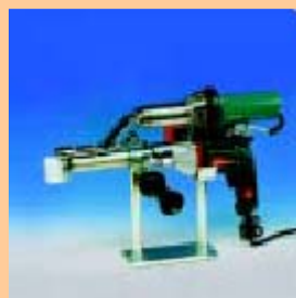
K 12 DE