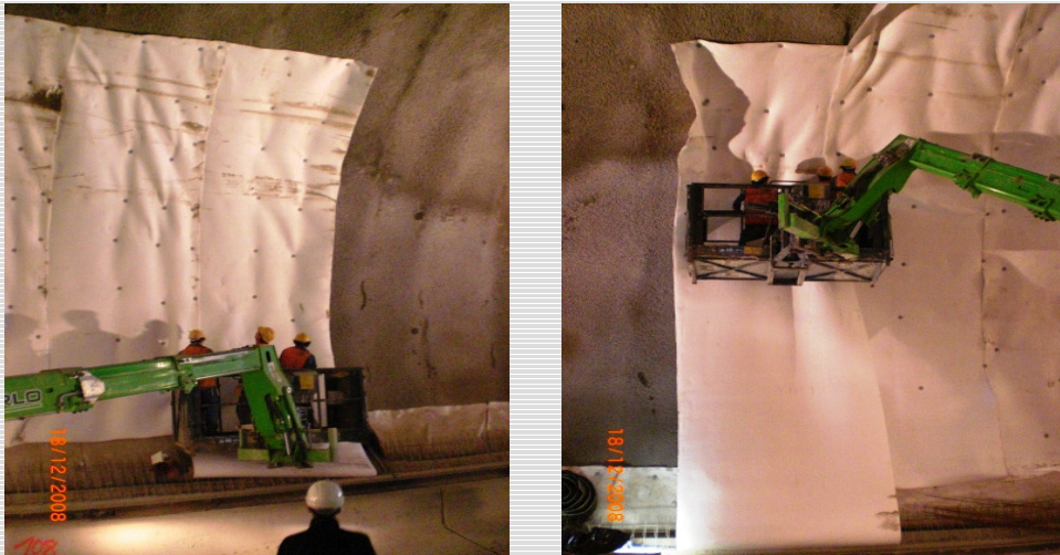
Abb. 3: Anbringen des Vlies auf Spritzbeton