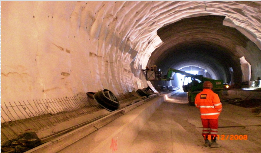
Abb. 1: Tunneleinblick u. Anbringen des Vlies