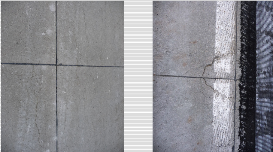
Abb. 1: Rissbildung in der vorhandenen Betonfahrbahn

Deckenerneuerung A 10, km 55,7 – 59,2, RF Potsdam Tank- u. Rastanlage Fichtenplan