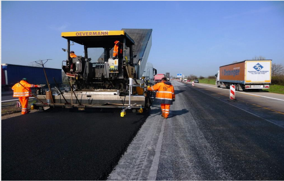
Abb. 5: Überbauung mit Asphalt