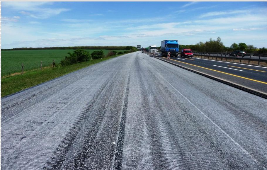
Abb. 4: Fertig verlegtes und abgesplittetes Gitter