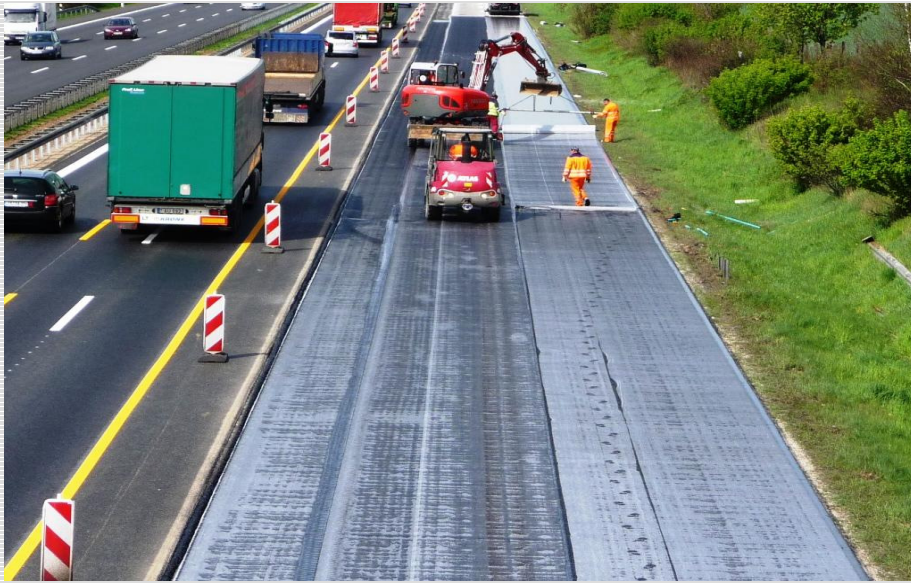
Abb. 3: Verlegung und fertige Fahrbahn